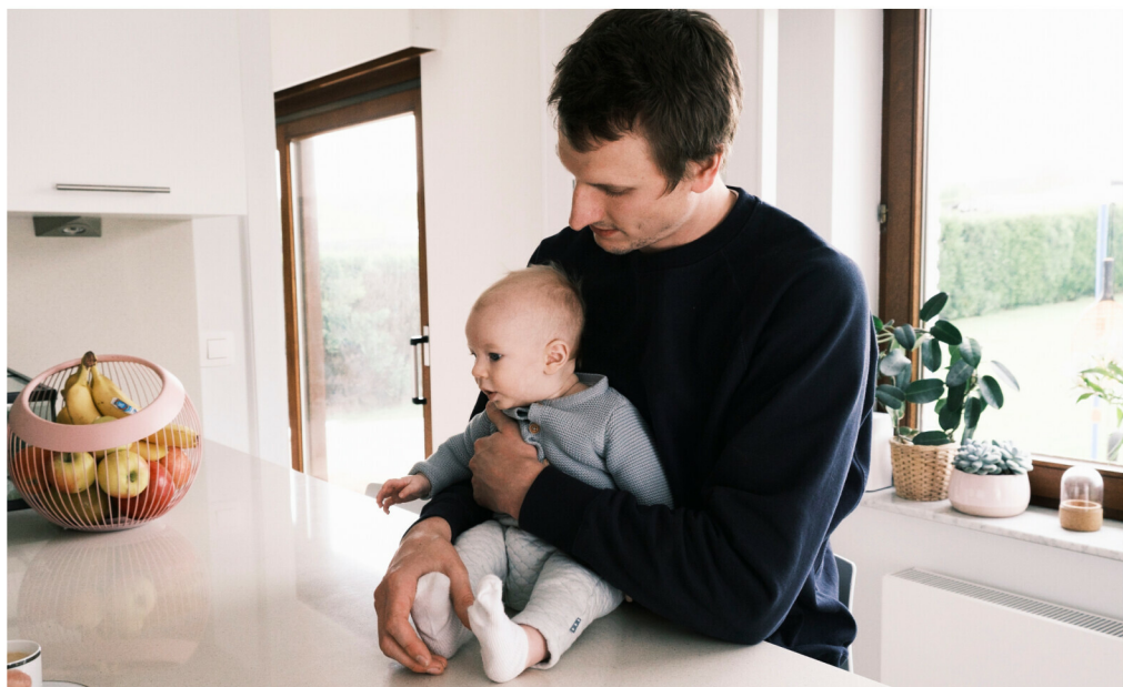
Het leven is mooi als je in papa's armen ligt!